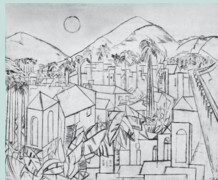
Água forte e ponta seca de Lasar Segall

“Pintura: eis a atualidade mais considerável da vida artística do Rio nestes últimos dias. As exposições se sucedem. Neste momento umas quatro ou cinco atraem aos respectivos salões uma multidão de visitantes [...]. É dessa categoria privilegiada o pintor russo Lasar Segall, que pela primeira vez expõe no Rio. A sua exposição tem importância capital para nós, pois se trata de nome considerado na Europa como um dos grandes mestres do movimento moderno.”