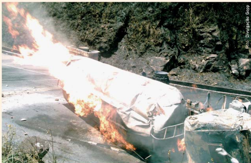
Percentual de acidentes atendidos pela Feema de 1983 a 26/03/2008 (%)

Ainda sobre 2005 e 2006, a pesquisa informa que, no primeiro ano, tais acidentes resultaram em 129 vítimas, sendo 116 feridos e 13 mortos. Em 2006 o trabalho aponta uma elevação do número de vítimas, somando 174, sendo 148 feridos e nada menos do que 26 mortos. Fato preocupante vem a seguir, quando os técnicos do DER-SP analisam os tipos de acidentes e listam a colisão traseira, que tem, segundo os estudiosos do trânsito, como principal causa a distração ou o adormecimento do condutor do veículo, como o acidente que mais se repetiu nas estradas paulistas naqueles dois períodos.