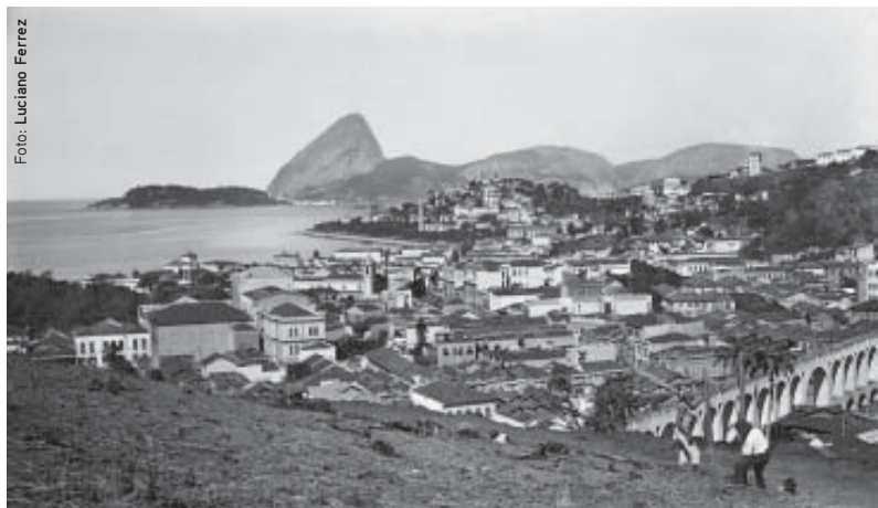
Bairro da Glória visto do morro de Santo Antônio, Rio de Janeiro, c. 1922