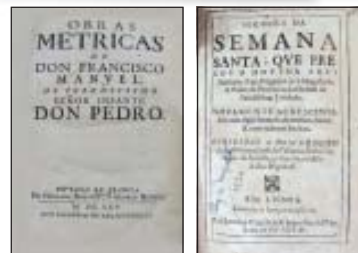
Ao lado, dois livros do acervo da São José, um editado em 1633 e o outro de 1665 estão avaliados cada um em cerca de R$ 5 mil.

Sebos tradicionais e novos convivendo harmoniosamente na cidade, com um só objetivo: oferecer ao ilustre freguês uma obra rara, uma foto antiga autografada, como a de Santos Dumont (na Babel), ou apenas um livro de seu interesse... tendo nas primeiras páginas aquelas dedicatórias afetivas imortalizadas pelo tempo. ■