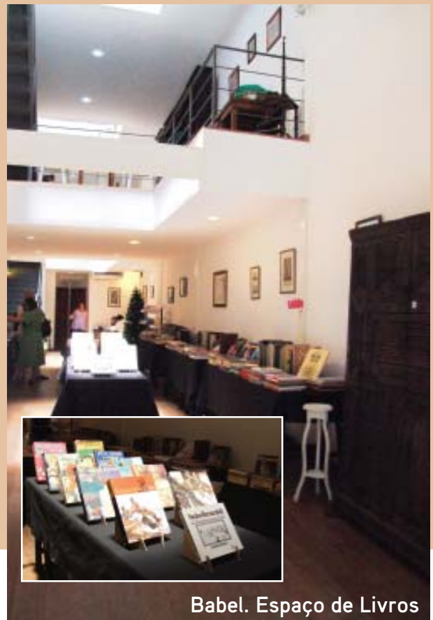
Babel. Espaço de Livros

existência, portanto, possui um acervo abrangente – desde livros técnicos e didáticos, até obras raras do século XVII –, privilegiando publicações brasileiras, literatura clássica e obras de ciências humanas em geral. Possui ainda um acervo com cerca de três mil discos de vinil, além de CDs e DVDs. Desde 2005, a livraria conta com um espaço dedicado a exposições e um café. Depois da inauguração do botequim, agora passou a servir almoço de segunda a sábado e happy hour de terça a sexta.