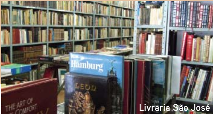
Livraria São José