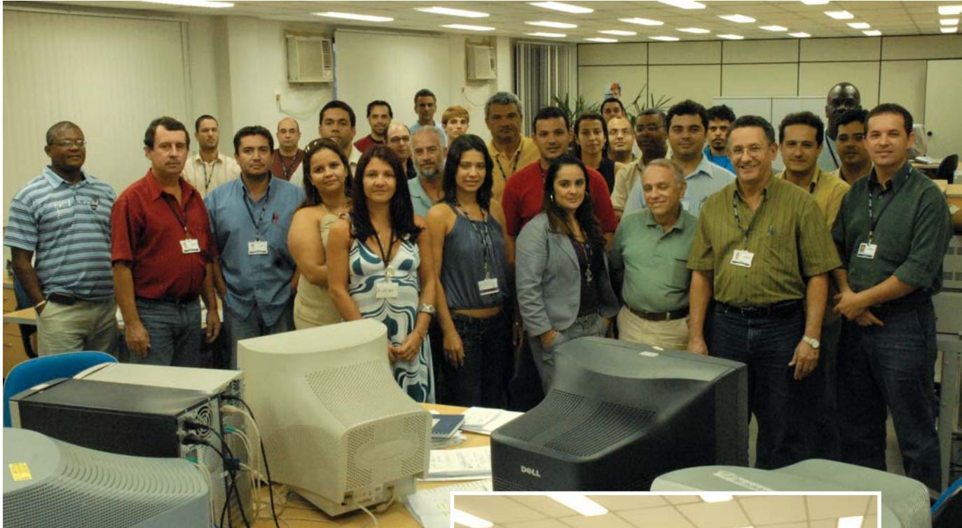
Engenharia da Aibel Macaé

Macaé. "As contratações já estão em andamento. Vamos precisar de pessoas de diferentes áreas, desde ajudantes, caldeireiros e soldadores, até engenheiros de processos. Além disso, essas novas plataformas exigirão, em suas mobilizações, um grande número de profissionais. Também está previsto contratar cerca de 60 profissionais temporários para Parada de Produção de algumas plataformas deste Contrato. Muitos deles poderão ficar na empresa depois", reforçou.