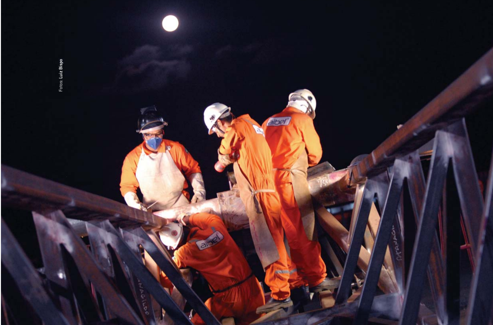
Reforma do Mastro da Sonda da Petrobras

(BAD) expedido pela Petrobras. “Isso mostra que o contrato atingiu um ponto muito avançado de execução e em termos empresariais esta graduação nos dá um reconhecimento interno e externo. Isso é um demonstrativo que o cliente está realmente satisfeito com o nosso trabalho”, observou.