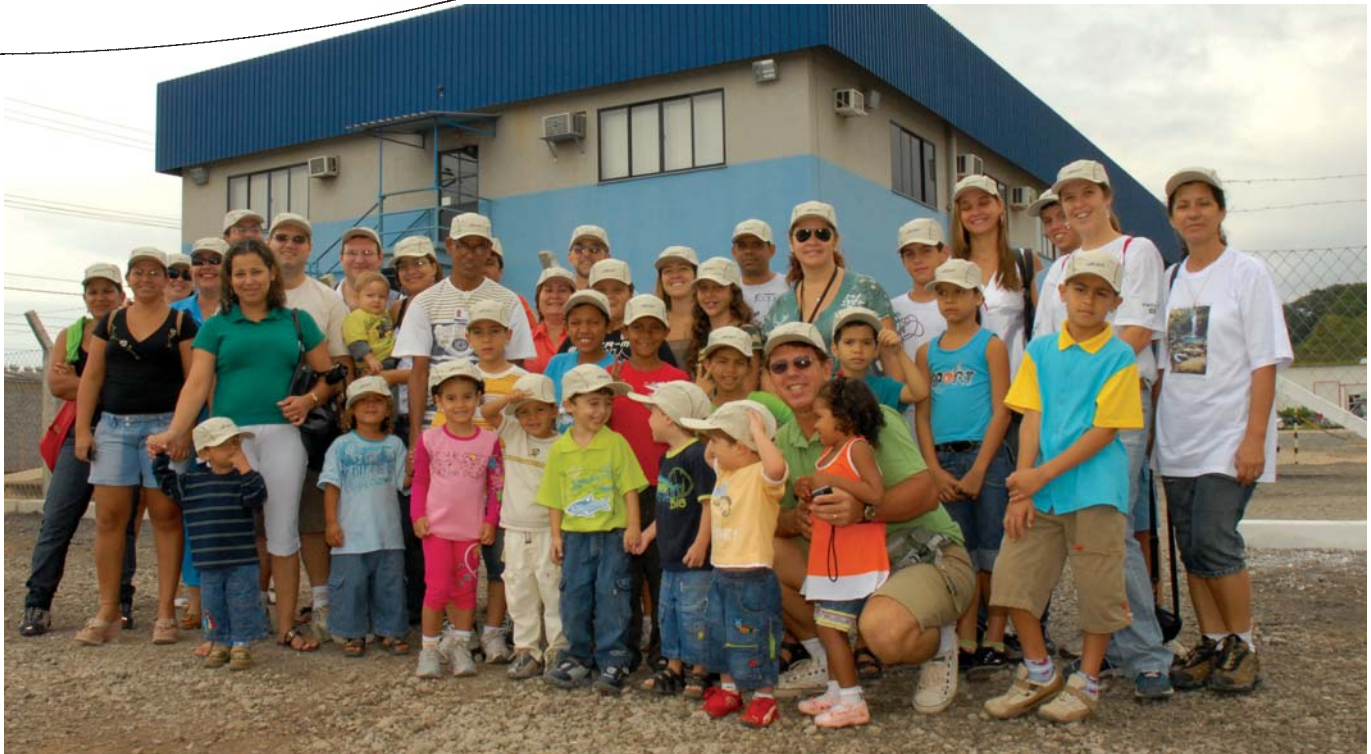
Dia do Plantio das Mudas na Aibel

função de auxiliar administrativo. Depois de reabilitados esses profissionais podem ser empregados na Aibel ou em outras empresas, que aproveitam esses talentos.